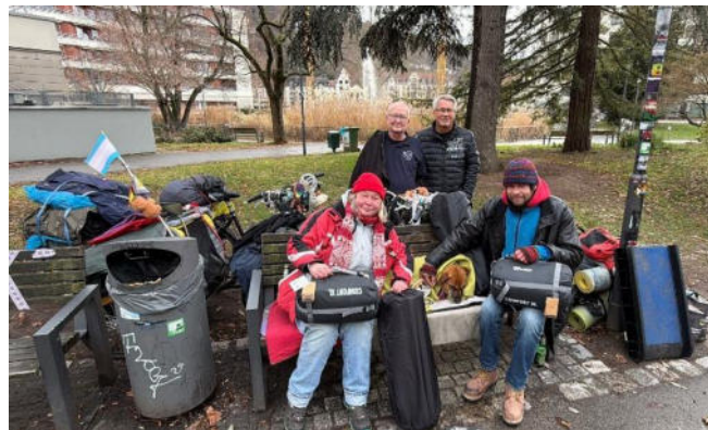
Übergabe winterfester Schlafsack und passende Isomatte an Bedürftige

Atmosphäre zu verwandeln. Daher ist es unser aller Bestreben, das Gefühl zu vermitteln: „Du bist wertvoll und nicht alleine“.